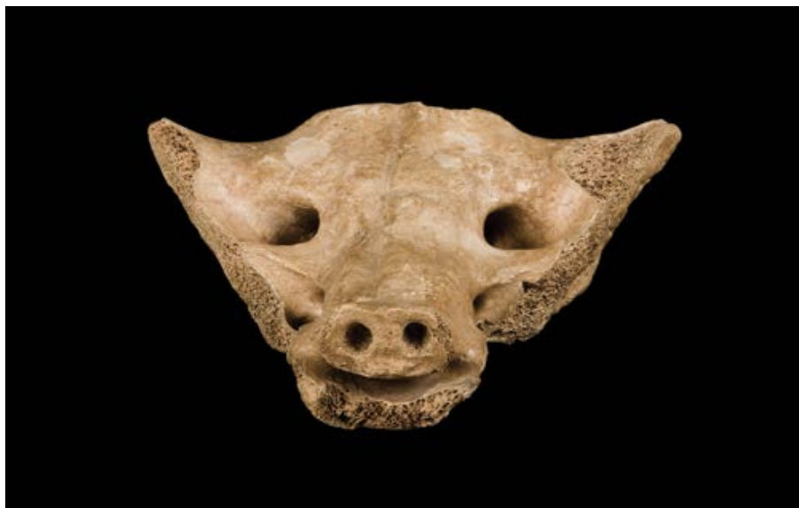
Figura 2. El sacro de Tequixquiac es considerado como una evidencia de arte prehistórica. Se trata del sacro de un camélido pleistocénico, en el cual trataron de representar la forma de una cabeza de cánido. Esta pieza fue localizada en 1870, en el poblado del mismo nombre, en el Estado de México.

En cuanto a cómo es que se dividían el trabajo en estas sociedades; se dice que existe una división social y sexual del trabajo, donde la repartición de actividades recae de la siguiente forma: la caza, como una actividad exclusiva del género masculino, y la recolección como una actividad realizada por las mujeres y niños. Es