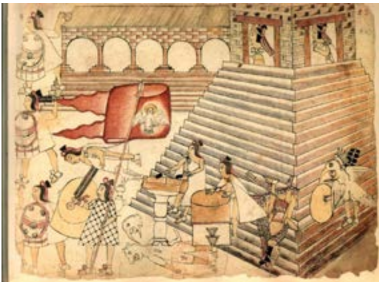
Figura 3. Matanza de Templo Mayor durante la fiesta de Tóxcatl o renacimiento de Tezcatlipoca. Códice Azcatitlan, BNF, lám. 23.

De acuerdo a las fuentes, en la primera incursión de los españoles, los chalcas participaron incorporándose a las tropas que auxiliaron a Cortés por disposición de sus señores. Como mencionamos arriba, se indica que fueron elegidos 20 chalcas para acompañar a las huestes hispano-indígenas. Sin embargo, no tenemos muy claro cuál fue el auxilio que prestaron los ejércitos chalcas en esta primera etapa. Las fuentes mencionan de manera general a los chalcas como parte del contingente que llegó a la ciudad, pero no sabemos si estuvieron presentes cuando los mexicas solicitaron a Alvarado la autorización para realizar la fiesta de Tóxcatl, ni tampoco si participaron en la contienda durante la matanza de Templo Mayor.