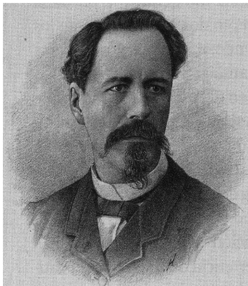
Figura 1. Cromo tomado de litografía, Los hombres prominentes de México, editor Irineo Paz, México, Imprenta y Litografía “La Patria”, 1886.

Durante el siglo XIX, la morfología territorial de México —así como la de muchos países latinoamericanos— se vio modelada y transformada profundamente por fenómenos bélicos y políticos cuya trascendencia define hasta el día de hoy la geografía nacional. En este periodo, el papel de los geógrafos, cartógrafos e historiadores fue crucial para definir y proyectar una imagen del país en ciernes. Antonio García Cubas fue uno de los personajes más importantes en la conformación de la idea de una geografía de México durante la segunda mitad del siglo XIX. (Figura1).