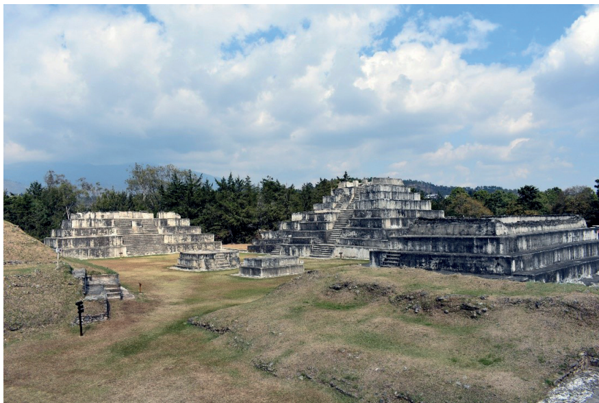
Figura 2. La plaza principal de Zaculeu vista en dirección noreste.

Zaculeu es un antiguo asentamiento maya de tierras altas ubicado en el occidente de Guatemala (Figura 2). Además de su importancia para la arqueología y la historia antigua de los pueblos mayas, hoy Zaculeu es un lugar relevante para las prácticas religiosas contemporáneas de los pueblos mayas guatemaltecos y una atracción turística de primer orden en la región. La información sobre la arqueología de Zaculeu procede de los trabajos de investigación realizados de por la United Fruit Company (de aquí en adelante UFCO) en el sitio, de 1946 a 1950 (Woodbury y Trik, 1953). Estos trabajos se llevaron a cabo en medio de tensiones políticas entre el gobierno