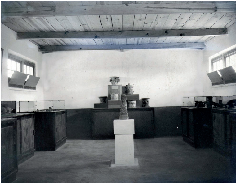
Figura 3. La sala del museo de Zaculeu, como la instaló la UFCO a finales de la década de 1940.