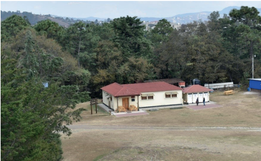
Figura 4. Vista exterior del museo de Zaculeu, como luce en la actualidad.

En particular deseo resaltar tres aspectos fundamentales que permitirían en el futuro un retorno local de la colección, no solo de Zaculeu, sino de otros sitios arqueológicos de las tierras altas mayas excavados en el siglo XX: 1) las reflexiones necesarias sobre las historias particulares de las colecciones nacionales 2) las contradicciones inherentes a la patrimonialización y sus discursos, y 3) las preguntas sobre el futuro de la investigación arqueológica y el manejo de los objetos-patrimonios recuperados en la actividad científica. Debe advertirse que muchas de estas propuestas no pueden escapar a las limitaciones impuestas por los marcos legales vigentes para la protección del