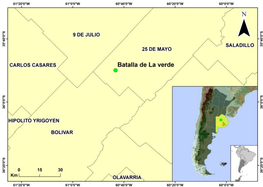
Figura 3. Mapa donde se ubica la batalla de La Verde en el partido de 25 de Mayo, Provincia de Buenos Aires (L. Coll).

retrocarga Remington y Martini-Henry (en menor cuantía), y proyectiles de plomo calibre .43 y .45 (Figura 4). Asimismo, fueron hallados botones con la figura del escudo patrio en su anverso e inscripciones que arrojaron datos sobre su marca y procedencia (T W A W PARIS, SLICK & WRIGHT... y SMITH & WRIGGT...), permitiendo identificarlos como elementos importados (Francia e Inglaterra) pertenecientes a chaquetas de uniformes militares. Estos permitieron realizar un primer análisis distribucional y contrastar la información arqueológica con las referencias documentales sobre lo acontecido (Landa et al. , 2011; 2014).