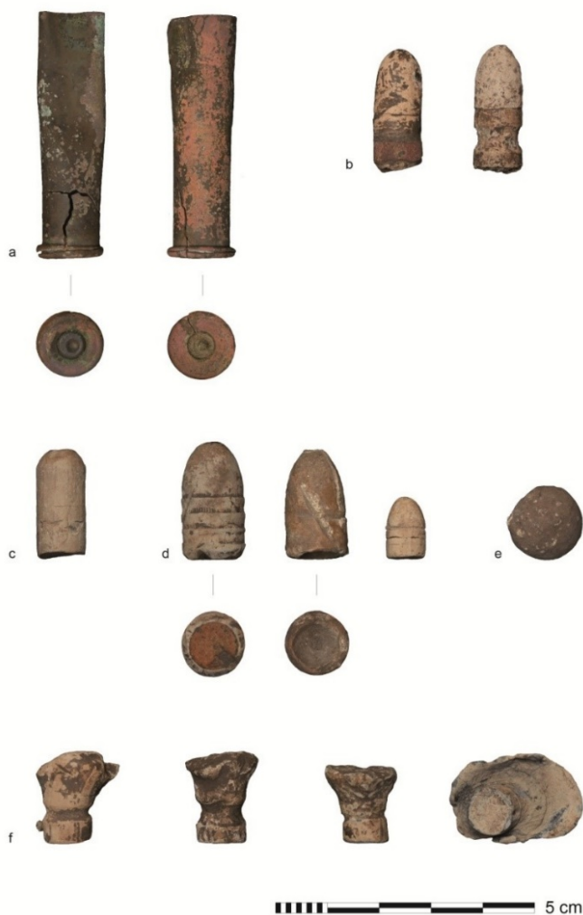
Figura 4. Diferentes tipos de munición de armas de fuego personales halladas en el sitio. Referencias: a) vainas de Remington (servidas); b) proyectiles de Remington ; c) proyectil de Martini-Henry ; d) proyectiles Minié; e) bala esférica; y f) proyectiles de Remington impactados (N. Ciarlo).

De acuerdo a las expectativas, se establecieron de modo aproximado las posiciones relativas de ambos contendientes y la dispersión de los proyectiles en relación a la posición defensiva que adoptó el Teniente Inocencio Arias. Puntualmente, la localización espacial de estos elementos referidos permitió discriminar entre los puntos desde donde se efectuaron los disparos (vainas) y