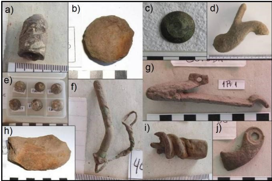
Figura 2. Materiales arqueológicos relacionados con la batalla: a) proyectil ojival de fusil de cañón rayado Enfield; b) proyectil de metralla de artillería; c) botón militar con inscripción "2 - Guardia Nacional", perteneciente al ejército de Buenos Aires; d) martillo de fusil de percusión; e) balas esféricas de armas de avancarga y cañón liso; f) estopín de fricción de artillería; g) muelle de martillo o pie de gato de arma de fuego; h) esquirla de granada de obús; i) sacatrapos para fusil; j) fragmento de contraplatina de arma de fuego.

Las distintas líneas de investigación implementadas han comenzado a producir información novedosa que permite profundizar en el entendimiento de la batalla, más allá de las descripciones presentes en la mayor parte de los estudios historiográficos que existían hasta el momento. Así por ejemplo, la compleja distribución espacial de materiales identificada en la parte este del campo de batalla parece reflejar una sucesión de eventos que es compatible con el relato de Mitre acerca de los acontecimientos que tuvieron lugar en el flanco izquierdo del ejército de Buenos Aires, que incluyeron avances de infantería, artillería y caballería nacional, desbande y retirada de unidades de caballería e infantería porteña, fuego de artillería de ambas partes, combates de infantería y un contraataque con cambio de frente por parte del ejército de Buenos Aires, todo ello en el lapso de escasas dos horas. En suma, la investigación del campo de Cepeda reafirma la validez de la arqueología de campos de batalla como vía para enriquecer el conocimiento de este importante hecho histórico.