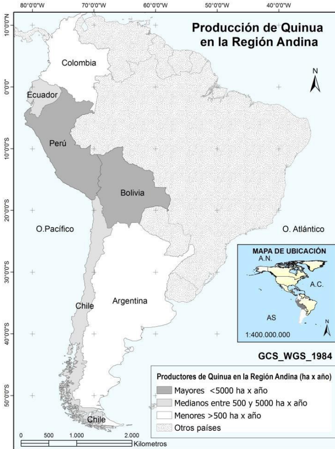
Figura 1. Mapa de la producción de Quinua en la región andina. Elaboración propia a partir de datos de FAO (2019).

sino también, porque constituye un elemento central de la agrobiodiversidad andina, el mismo que ha sido mantenido, protegido y preservado por los pueblos andinos. (FAO, 2014).