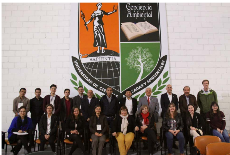
Figura 2. El Grupo de Trabajo del Atlas del Cambio Climático de las Américas se reúne en la Universidad de Ciencias Aplicadas y Ambientales (UDCA) de Bogotá, Colombia.

Durante tres días, del 14 al 17 de agosto de 2017, 14 investigadores internacionales de Argentina, Brasil, España, Estados Unidos, y México, y alrededor de 34 nacionales de Colombia, se reunieron en el Instituto Geográfico Agustín Codazzi (IGAC) y la Universidad de Ciencias Aplicadas y Ambientales (UDCA) en Bogotá, Colombia, para avanzar con el proyecto de Atlas del Cambio Climático de las Américas. El taller inició con un ciclo de conferencias a cargo de investigadores invitados. Después, los investigadores reunidos discutieron el estado del arte de la información sobre cambio climático en las Américas y los posibles modelos de atlas. Hubo una revisión de publicaciones internacionales precedentes que habían elaborado cartografía temática sobre cambio climático. Seguidamente surgió un debate que trató de aclarar la diferencia entre un proyecto de investigación sobre cambio climático y un medio de difusión como un Atlas del Cambio Climático. Las discusiones también se orientaron en identificar el objetivo principal, el público del atlas y el marco teórico; luego se centraron en la escala del atlas: cómo definimos las Américas?, ¿cuáles serán las unidades de estudio?, ¿cuáles sectores y áreas son más vulnerables al cambio climático?, ¿el Atlas tendrá una perspectiva actual o prospectiva?