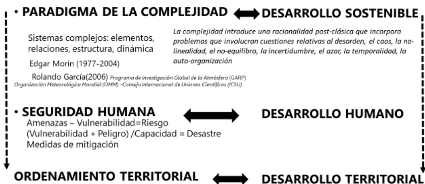
Figura 3. Los sistemas complejos y su relación con desarrollo, ordenamiento territorial, la seguridad humana y la paradoja de la complejidad.

La complejidad incorpora desafíos que involucran preguntas relativas al caos, la no-linealidad, la incertidumbre, el no-equilibrio, la temporalidad, y el azar (Rodríguez Zoya, Leonardo G. y Leónidas Aguirre, 2011). Las ciencias de la complejidad introducen una metodología que incluye la modelización y simulación de sistemas complejos además de constituir una tercera vía de hacer ciencia, que es complementaria a la deducción y la inducción (Maldonado y Gómez Cruz, 2010).