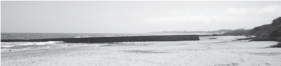
Figura 3. Fotografía de espigón socavado, no cumple su función original, retener arena transportada por la deriva litoral, ni evita el retroceso del barranco.

El caso de La Floresta preocupa a las autoridades locales y a los vecinos, quienes son conscientes del riesgo al que están expuestas sus propiedades (“Malestar en La Floresta por situación de playas”, s.f.) y (“La Floresta busca soluciones (...)”, s.f.). Se han realizado consultorías para encontrar una solución al problema (IMFIA, 2008), y para evaluar el impacto ambiental de dichas soluciones (INCOIV, 2013). En particular, con colocación de un rompeolas de geotubo entre algunos espigones, con el objetivo de disipar la energía de la ola antes de que llegue a la costa y de generar punto subacuático para retener arena, según el modelo aplicado se espera la posible formación de una saliente o de un tómbolo (según la disponibilidad de arena en el sistema). Sumado a esto se propone reparar los espigones socavados.