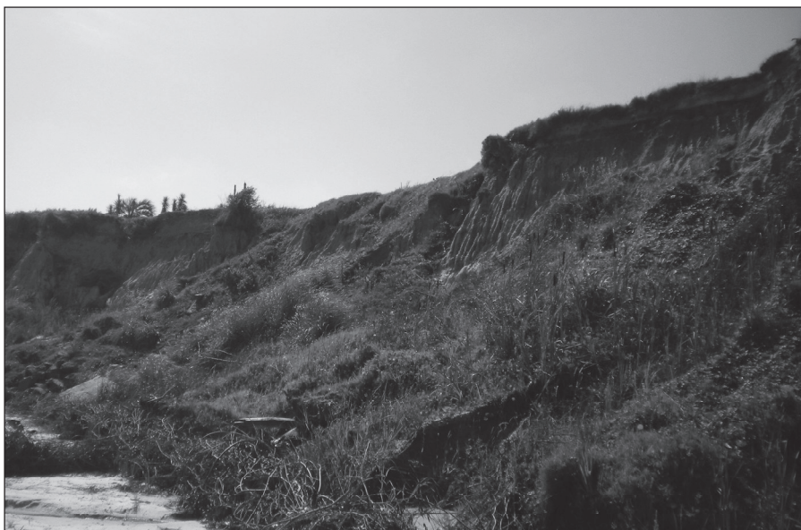
Figura 4. Barranca activa en Costa Azul, La Floresta.