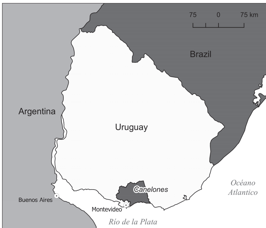
Figura 1. Mapa general de Uruguay y el departamento de Canelones.

En los segmentos censales correspondientes a localidades definidas por el INE y ubicados en la costa viven 155,874 personas, aproximadamente el 30% de la población de todo el departamento.