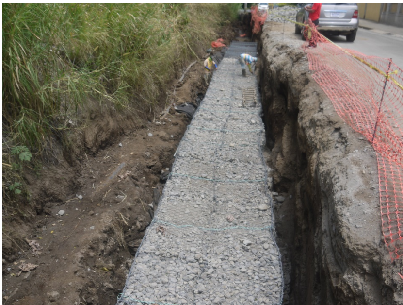
Figura 3. Construcción del último gavión en 2019. La foto fue tomada el 1 de mayo de 2019 cuando la construcción estaba en pleno apogeo. La vista es hacia el sur.