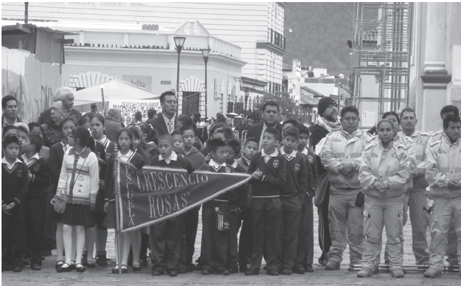
Fotografía 1. Celebración del 5 de Febrero, 2016 (autor: Juan Carlos Sarazúa).

En una fría mañana del 5 de febrero último, en la plaza central de San Cristóbal de las Casas frente al Palacio Municipal en construcción, se reunieron autoridades del Estado y la Ciudad acompañados de escolares, una banda militar y personal de servicios ciudadanos. La reunión tenía como objetivo festejar los 99 años de la actual Constitución Mexicana (1917), una de las grandes efemérides que se celebran en la actualidad en ese país (véase Fotografía 1). Más allá de los periodistas, unos turistas y unos pocos habitantes de la ciudad, la celebración no era tan concurrida como se podía esperar. Los discursos estaban dirigidos a rescatar la esencia de la nación mexicana en general, pero también el tema de la integración de todos los “mexicanos”, es decir, la formación de la nación mexicana. Un discurso muy significativo pues en ese mismo momento, a unos metros del festejo, la plaza frente a la Catedral de San Cristóbal de las Casas estaba ocupada por representantes indígenas y campesinos del Estado que protestaban por las condiciones económicas y la poca atención a sus necesidades por parte de las autoridades. Un símbolo de las contradicciones que atraviesan a todos los habitantes del Estado desde el punto de vista étnico y social.