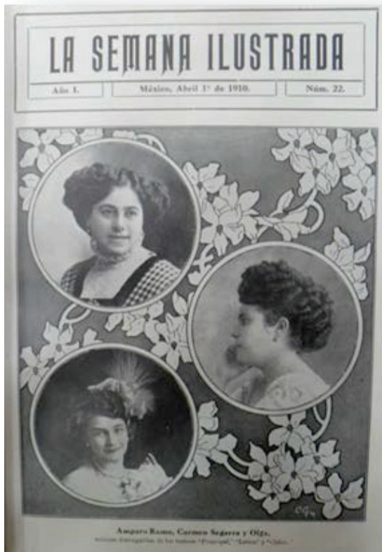
Fotografía 4. Portada La Semana Ilustrada .

Diario Ilustrado Independiente , 44 además del libro Hacia la verdad: Episodios de la Revolución de Gonzalo G. Rivero. 45 Tanto La Risa como La Actualidad fueron publicaciones, netamente de corte político, que señalaron su abierta oposición a la revolución maderista. La primera, es una vasta colección de caricaturas de la vida cotidiana y política del país.