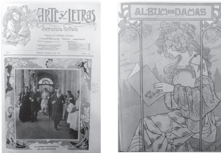
Fotografía 3. Portadas Arte y Letras y Álbum de Damas .