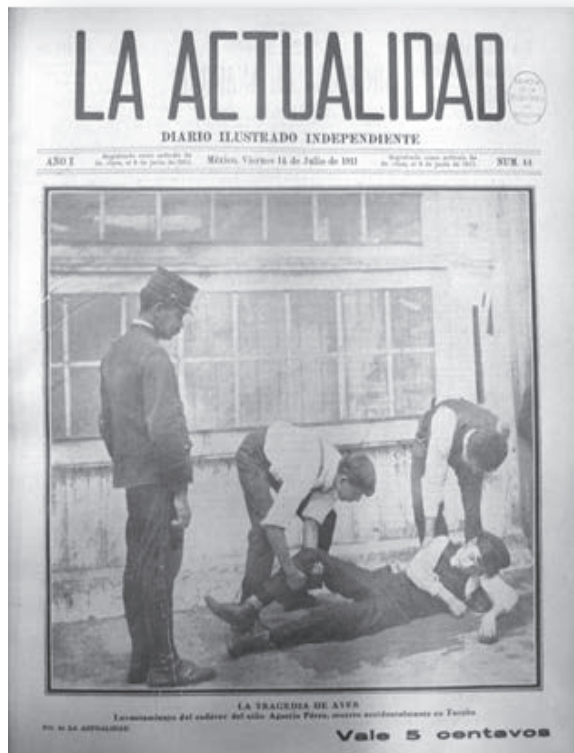
Fotografía 5. Portada La Actualidad .