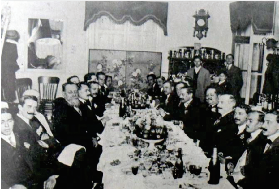
Fotografía 6. Ernesto Chavero, Venustiano Carranza y el cuerpo de redacción de El Demócrata Mexicano y La Compañía Editora Nacional.

nómico del país. Más tarde, cuando entró a formar parte de una de las élites más cerrada y ultra minoritaria de México, como lo fue, y sigue siendo, ser miembro de la Cámara Legislativa; este personaje aprovechó su contexto y tejió redes políticas, económicas y sociales que le favorecieron para desarrollar su empresa editorial, el crecimiento económico de su negocio se benefició con las ventajas que otorgó la “Ley de Sociedades Anónimas”; como hemos podido señalar, entre sus socios figuraron diputados, empresarios y banqueros, la mayoría de ellos, distinguidos por sus múltiples actividades industriales.