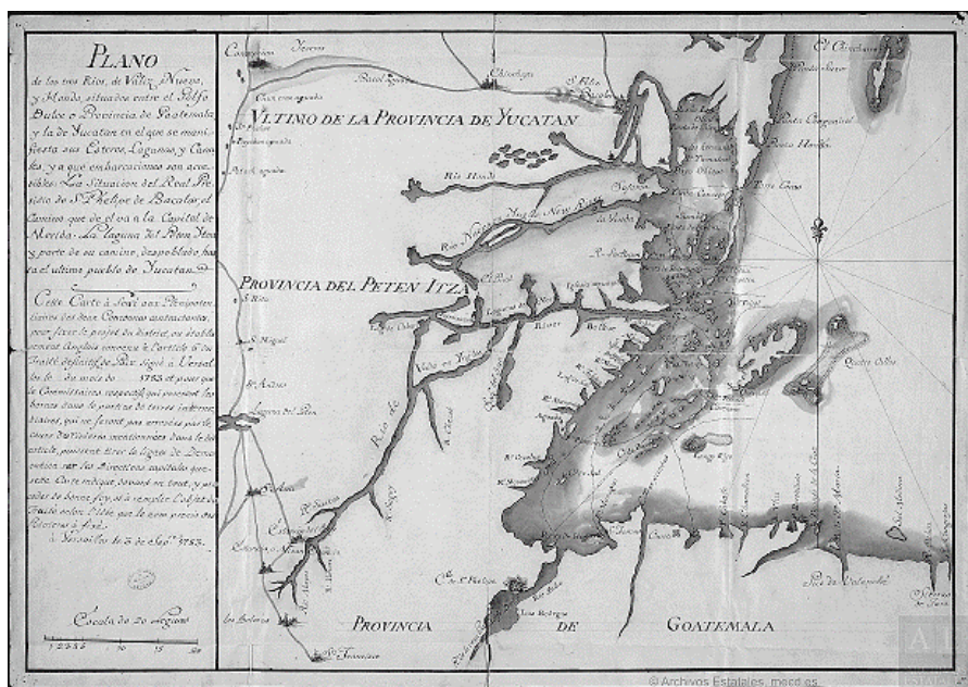
Figura 1. El suroriente de la provincia de Yucatán. El presente mapa fue elaborado para mostrar el territorio que sería entregado a los británicos para la explotación maderera conforme al Tratado de Versalles de 1783. Pueden apreciarse los principales ríos de la región: el Hondo, el Nuevo y el Belice.

más, el gobernador Antonio de Figueroa y Silva restauró la villa de Bacalar, con colonos provenientes de las Islas Canarias, y construyó la fortificación abaluartada de San Felipe entre 1727 y 1732. El infatigable militar envió a