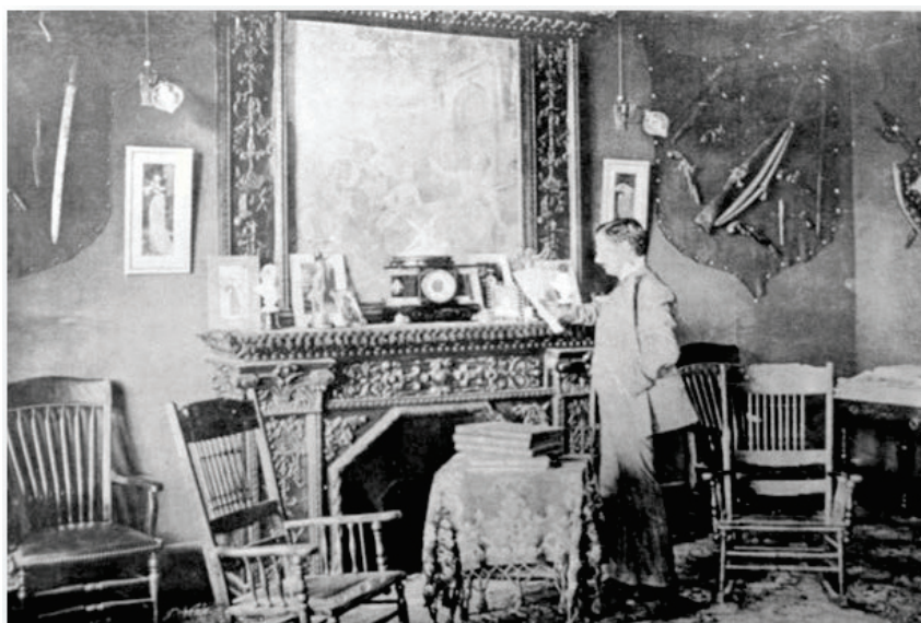
Fotografía 2. La Dirección, oficinas de Arte y Letras .

sa de Chavero adoptó la figura de “Sociedad Anónima”, 36 hecho que le permitió desarrollar su negocio editorial sin arriesgar el patrimonio familiar. Con este marco de acción, la Compañía editó las publicaciones de Arte y Letras y Álbum de Damas . En sus talleres se imprimió la obra El Señor Root en México , 37 libro que hace la crónica de la visita a México, en octubre de 1907, del Secretario de Estado y titular del Departamento de Defensa de Norteamérica, Elihu Root, quien se presentó para fortalecer las relaciones de amistad de su país con el gobierno mexicano. Tal acto fue correspondido con singulares eventos, entre ellos, la edición bilingüe e ilustrada